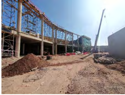
Ejecución de obras correspondientes a vigas y coronaciones de pilares, sector 1.2 Edificio Terminal de Pasajeros