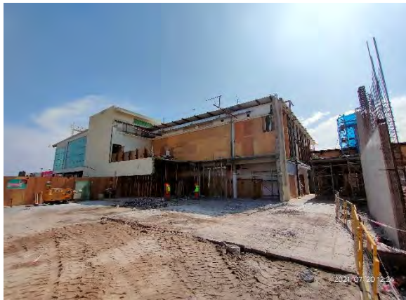
Trabajos de desarme y demolición, sector 1.3 Edificio Terminal de Pasajeros Existente