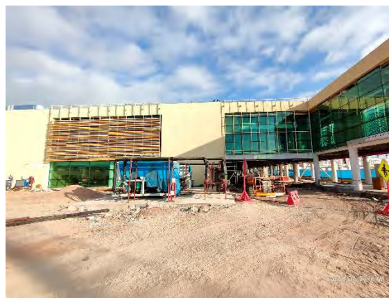
Instalación de Componentes de Celosías (Estructura metálica soportante y lamas), Sector Norte Ed. Terminal de Pasajeros

A la fecha, y en base a lo indicado en el punto anterior, la SC durante este periodo ha procedido con el avance de obras, las cuales se presentan en el siguiente registro fotográfico: