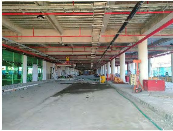
Descimbrés pendientes moldaje lateral de viga y losa, Ampliación Ed. Terminal de Pasajeros.