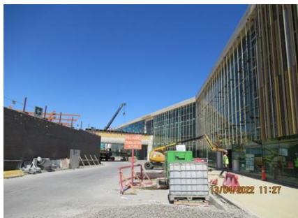
Fachada Oriente: avance en vialidad e instalación de celosías

A la fecha, y en base a lo indicado en el punto anterior, la SC durante este periodo ha procedido con el avance de obras, las cuales se presentan en el siguiente registro fotográfico: