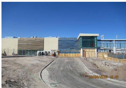
Ampliación Edificio Terminal, vialidades sector norte