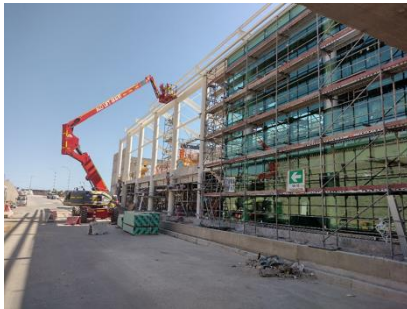
Fachada Oriente: avance de obra gruesa y terminaciones extremo sur

A la fecha, y en base a lo indicado en el punto anterior, la SC durante este periodo ha procedido con el avance de obras, las cuales se presentan en el siguiente registro fotográfico: