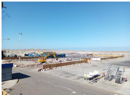
Obras en Plataforma de Aviones Sector Sur