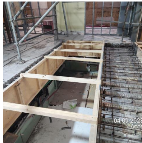
Instalación losa colaborante en 2° nivel PAX, para la integración de las nuevas cintas transportadoras de maletas.