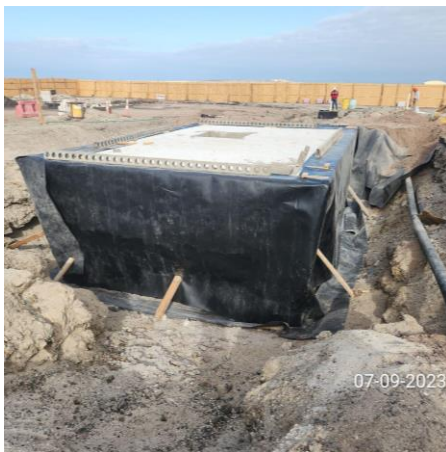
Instalación Geomembrana perimetral estructura "PEAS"