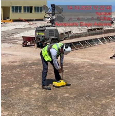
Toma densidad suelo en Plataforma Sur.