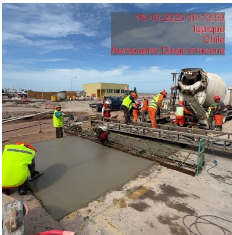
Hormigonado sección Plataforma Sur.