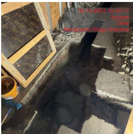
Construcción de Cámara de Alcantarillado N°15 y N°16 en calle de servicio, 1° nivel, PAX.