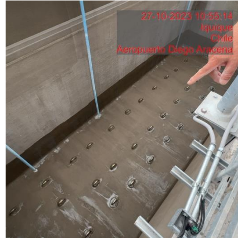
Reparación base en flanges del sistema de aireación PTAS.