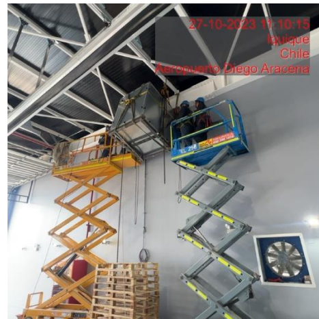
Instalación sistema de extracción de gases en nuevo cuartel SSEI.