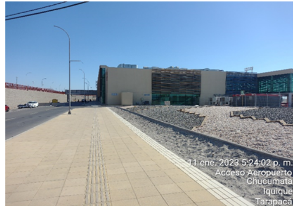
Fachada Oriente: Se ejecuta maquillaje de puente acceso norte