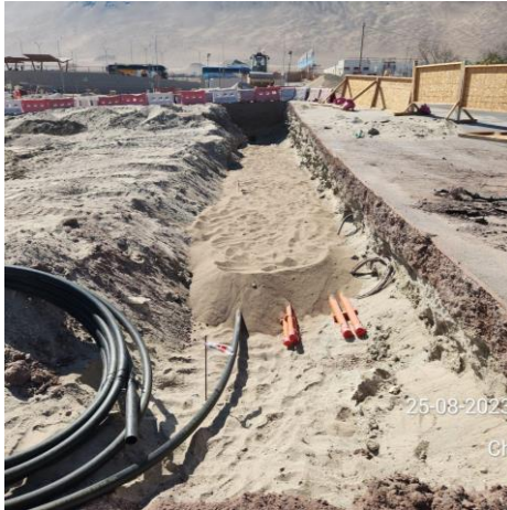
Trabajo banco ductos en sector CAP, Airside.