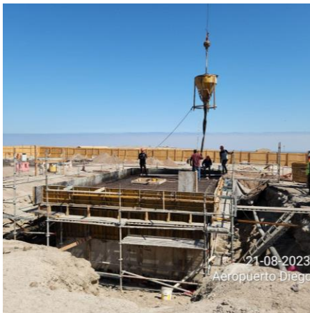
Hormigonado losa superior en estructura "PEAS"