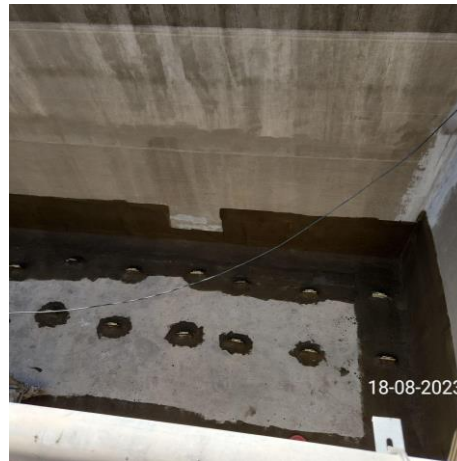
Impermeabilización líneas de tratamiento "PTAS" (actividad crítica según alcances del DS 68)