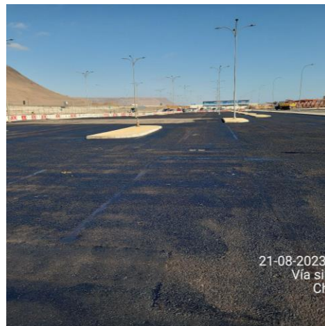
Riego de liga en estacionamientos PAX