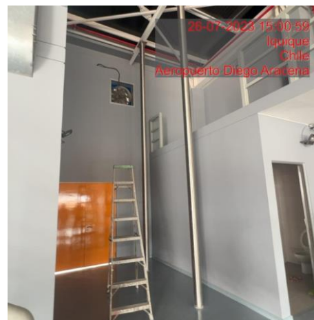
Reemplazo e instalación de tubos deslizamiento plataforma de emergencia edificio SSEI