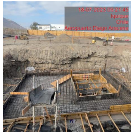
Confección enfierradura muro de la "PEAS"