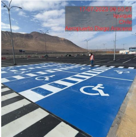
Demarcación vial para personas con movilidad reducida en estacionamientos PAX