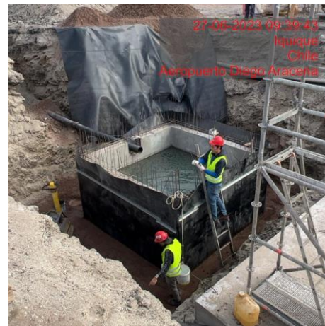
Relleno y compactación base estabilizada en "PEAS"