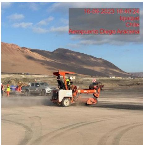
Limpieza a través en "Calle Hotel"