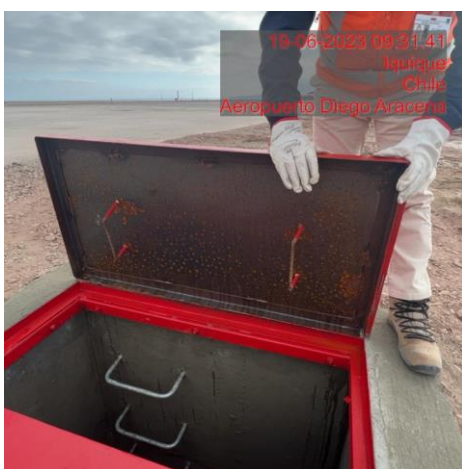
Confección e instalación escotillas en cámaras en travesío "Calle Hotel"