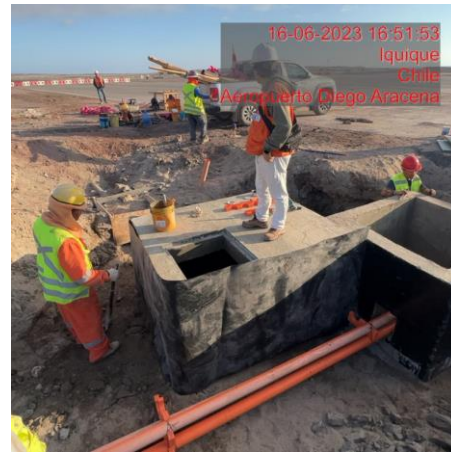
Confeción cámara eléctrica y sanitaria trabajos atraveso "Calle Hotel"