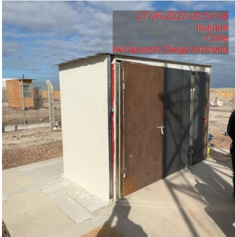
Reestructuración caseta "RX"