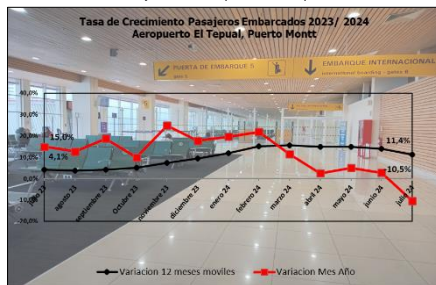
Gráfico 1: Tasa de Crecimiento Pasajeros Embarcados últimos 12 meses

(*) Corresponde a la variación acumulada a julio 2024 respecto similar periodo 2023.