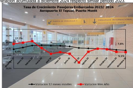
Gráfico 1: Tasa de Crecimiento Pasajeros Embarcados últimos 12 meses Fuente: Dirección General de Aeronáutica Civil

(*) Corresponde a la variación acumulada a diciembre 2024 respecto similar periodo 2023.