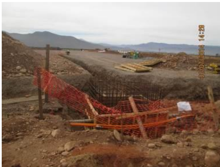
Foto N°09 Trabajos por Petrobras (DGAC), PIT N° 06 de combustible.