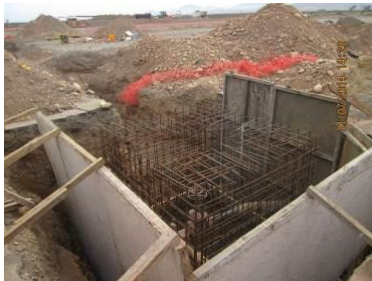
Foto N°08 Trabajos por Petrobras (DGAC), PIT N° 06 de combustible.