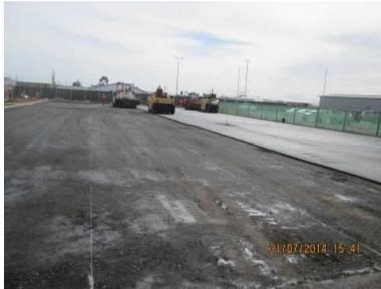
Foto N° 01 Trabajos de pavimentación estacionamiento públicos (Lado Sur)