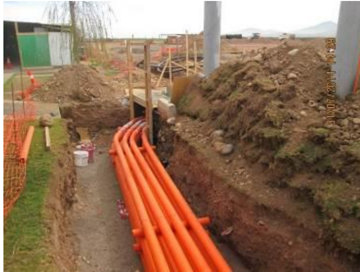
Foto N°07 Trabajos en cámaras eléctricas, hacia subestación de DGAC.