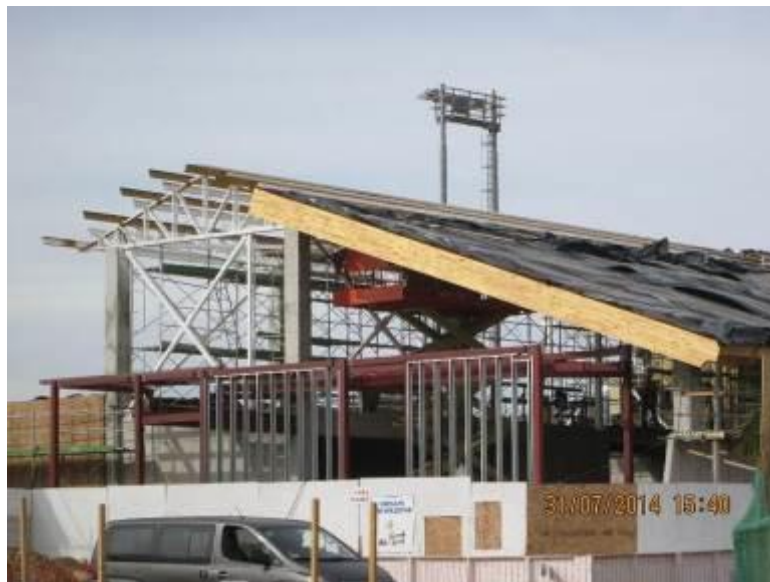
Foto N° 02 Vista techumbre costado poniente de Edificio Terminal.