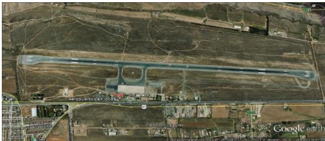
Fig. N° 02 Planta general de Aeródromo La Florida de La Serena, IV Región de Coquimbo.