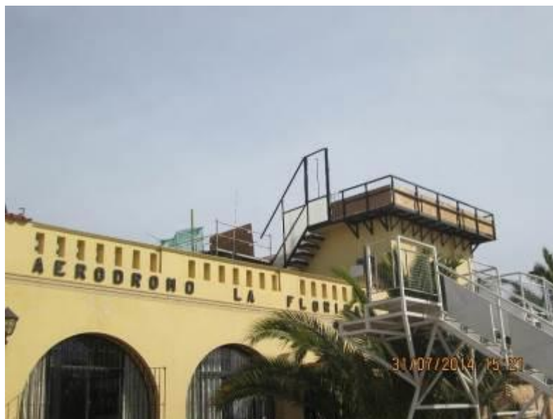
Foto N°06 Trabajos en Nueva Torre de Control. Solamente demolición de lo existente.