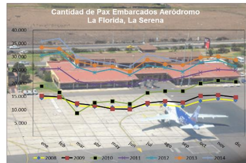
Gráfico 2: Pasajeros Embarcados de 2008 a 2014