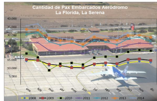
Gráfico 2: Pasajeros Embarcados de 2008 a 2014