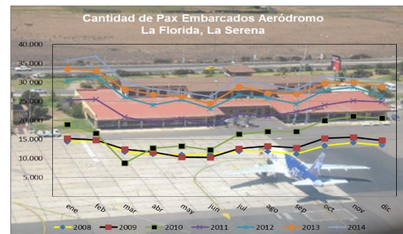
Gráfico 2: Pasajeros Embarcados de 2008 a 2014