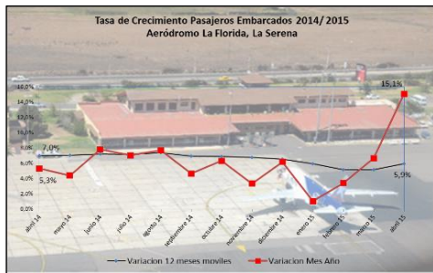
Gráfico 1: Tasa de Crecimiento últimos 12 meses

*Corresponde a la variación acumulada a abril 2015 respecto similar periodo 2014.