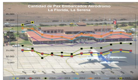
Gráfico 2: Pasajeros Embarcados de 2008 a 2014