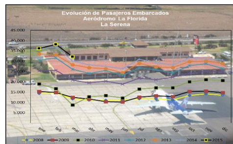
Gráfico 2: Pasajeros Embarcados de 2008 a 2015