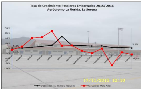
Gráfico 1: Tasa de Crecimiento Pasajeros últimos 12 meses