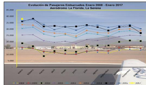
Gráfico 2: Pasajeros Embarcados de 2008 a 2017 Fuente : Dirección General de Aeronáutica Civil