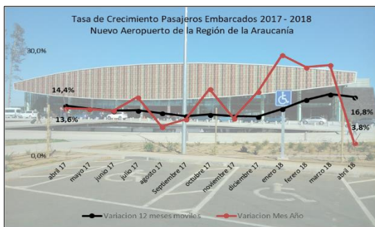
Gráfico 1: Tasa de Crecimiento últimos 12 meses

(****) Corresponde a una variación acumulada abril 2018 respecto similar periodo 2017.