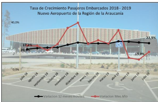
Gráfico 1: Tasa de Crecimiento últimos 12 meses

(****) Corresponde a variación acumulada julio 2019 respecto similar periodo 2018.