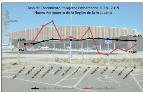
Gráfico 1: Tasa de Crecimiento últimos 12 meses

(****) Corresponde a variación acumulada septiembre 2019 respecto similar periodo 2018.