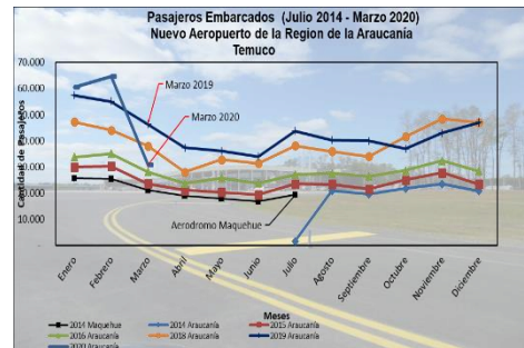
Gráfico 2: Pasajeros Embarcados año 2014 - 2020 Fuente: Dirección General de Aeronáutica Civil y JAC