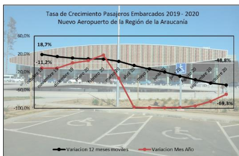
Gráfico 1: Tasa de Crecimiento últimos 12 meses

(****) Corresponde a variación acumulada octubre 2020 respecto similar periodo 2019.