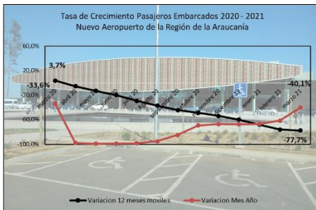
Gráfico 1: Tasa de Crecimiento últimos 12 meses

(****) Corresponde a variación acumulada marzo 2021 respecto similar periodo 2020.