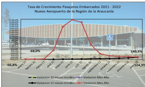
Gráfico 1: Tasa de Crecimiento últimos 12 meses

(****) Corresponde a variación acumulada enero 2022 respecto similar periodo 2021.