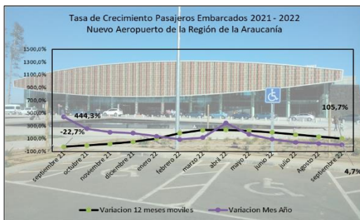
Gráfico 1: Tasa de Crecimiento últimos 12 meses

(****) Corresponde a variación acumulada octubre 2022 respecto similar periodo 2021.