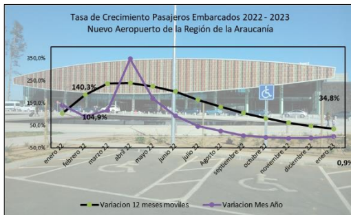
Gráfico 1: Tasa de Crecimiento últimos 12 meses