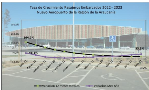
Gráfico 1: Tasa de Crecimiento últimos 12 meses

(****) Corresponde a variación acumulada julio 2023 respecto similar periodo 2022.