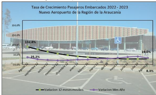
Gráfico 1: Tasa de Crecimiento últimos 12 meses

(****) Corresponde a variación acumulada agosto 2023 respecto similar periodo 2022.