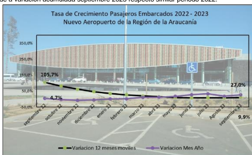
Gráfico 1: Tasa de Crecimiento últimos 12 meses

(****) Corresponde a variación acumulada septiembre 2023 respecto similar periodo 2022.