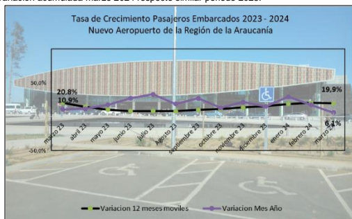
Gráfico 1: Tasa de Crecimiento últimos 12 meses

(****) Corresponde a variación acumulada marzo 2024 respecto similar periodo 2023.