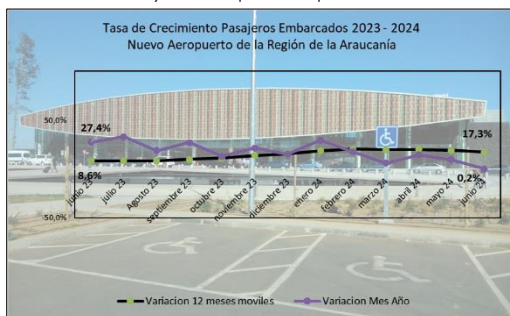
Gráfico 1: Tasa de Crecimiento últimos 12 meses

(****) Corresponde a variación acumulada junio 2024 respecto similar periodo 2023.