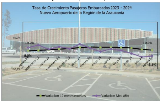
Gráfico 1: Tasa de Crecimiento últimos 12 meses

(****) Corresponde a variación acumulada agosto 2024 respecto similar periodo 2023.