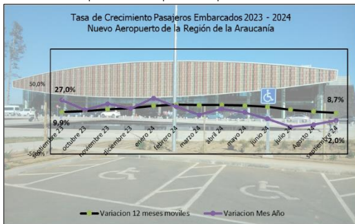
Gráfico 1: Tasa de Crecimiento últimos 12 meses

(****) Corresponde a variación acumulada septiembre 2024 respecto similar periodo 2023.