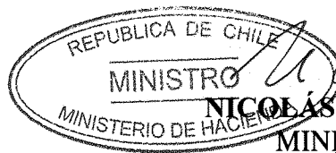
NICOLÁS EYZAGUIRRE GUZMÁN MINISTRO DE HACIENDA