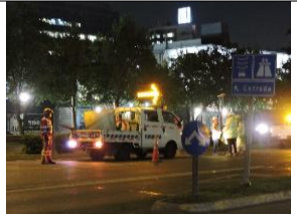
Levantamiento topográfico Ramal A, Lado Norte Kennedy Comuna de Vitacura