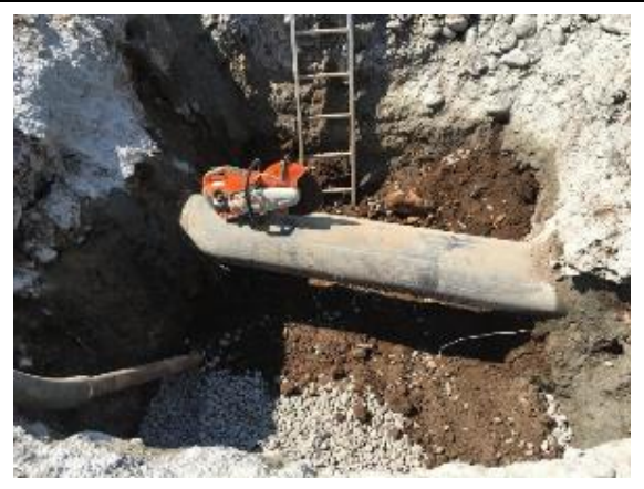
Trabajos en Parque Vespucio Comuna de Vitacura