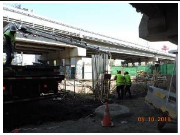
Trabajos Cepas El Salto