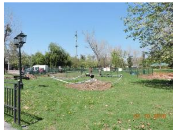
Trabajos de cierre Punto Limpio Actual