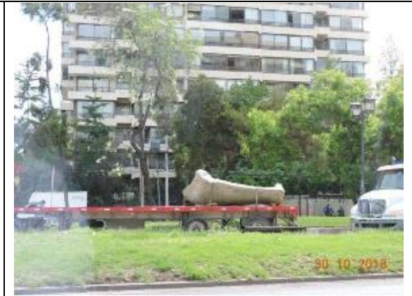
Retiro de esculturas Parque Vespucio Comuna de Vitacura