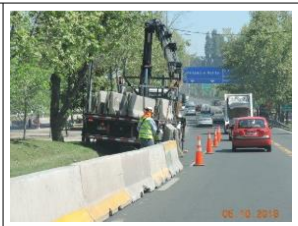
Trabajos de cierre del Parque Vespucio Sector Puente Centenario