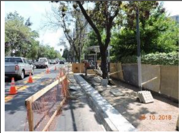
Habilitación de aceras, paraderos y construcción de medidas de mitigación Acceso Isabel La Católica