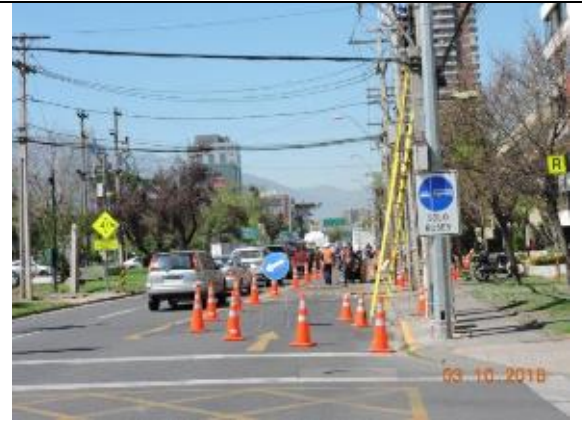
Mantención de luminaria Comuna de Las Condes