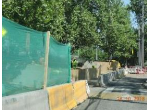
Trabajos de Aguas Andinas en Acceso a Pasarela Centenario