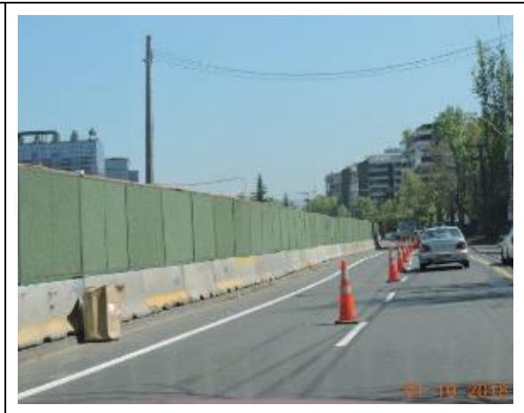
Habilitación y mantención de ciclovia Comuna de Vitacura