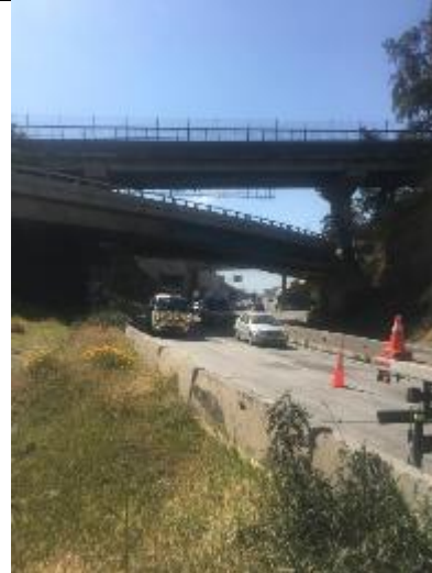
Mantenimiento de luminarias Puente Centenario