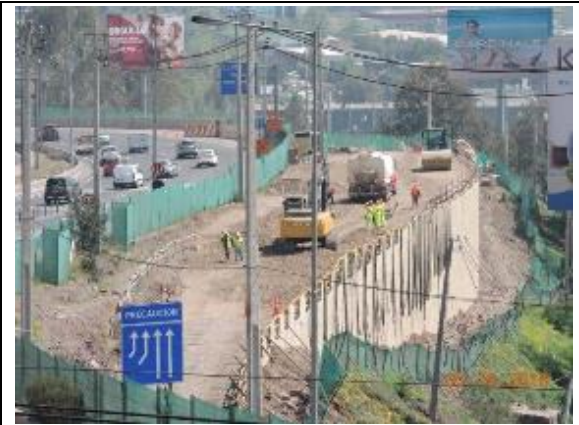
Trabajos Muro 8