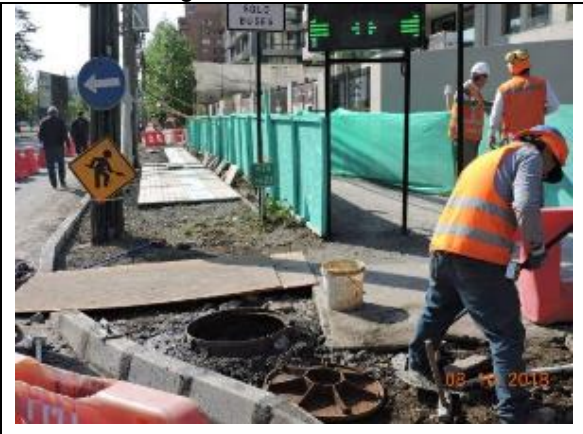
Habilitación de aceras y construcción de Acceso Cristobal Colon