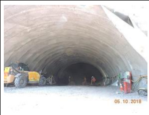
Trabajos Portal Norte Túnel