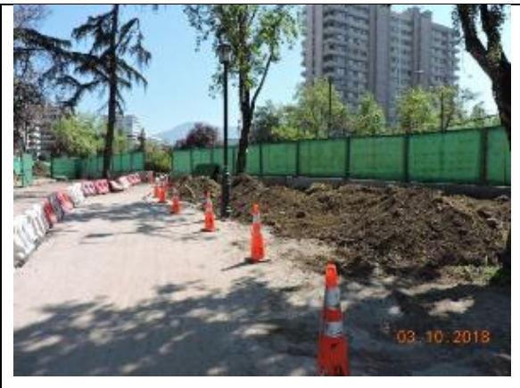
Trabajos en Parque Vespucio Comuna de Las Condes