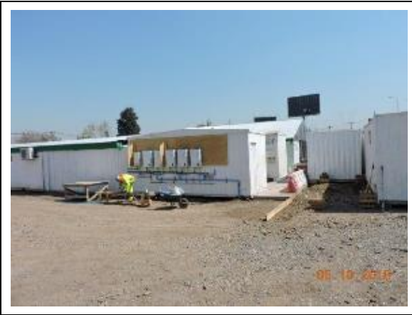
Instalación de Faenas Los Turistas