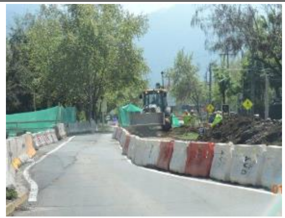
Trabajos en Desvío Punto Limpio