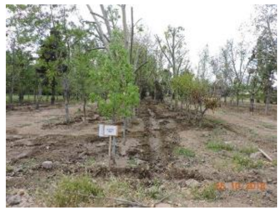
Visita al Vivero Sercotal donde se almacenan las especies arbóreas del Parque Vespucio