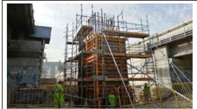
Viaducto El Salto- Sector Cepa 5, Dm 2.503,980