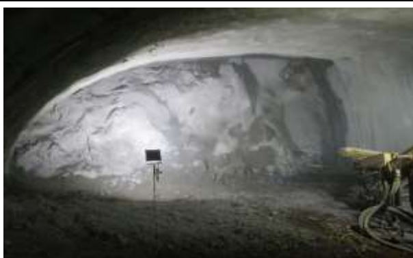
Túnel Minero Portal Norte – Marco 222, Dm 1.250,80