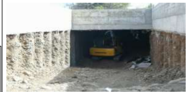
Excavación bajo Losa Ramal 255 (Francisco Bilbao) (Proyecto Híbrido) (Nivel -1)