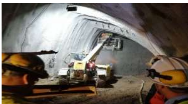
Túnel Acceso Sur – Inst. Marco 225, Dm 2.506,00