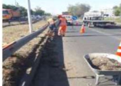
Limpieza de faja fiscal