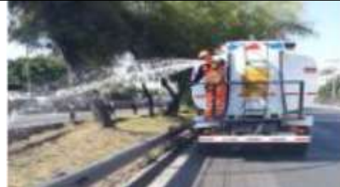
Riego de paisajismo