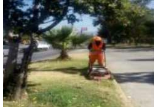
Corte de césped en vías laterales y bandejones

Se muestran imágenes de las actividades de conservación de la infraestructura preexistente.