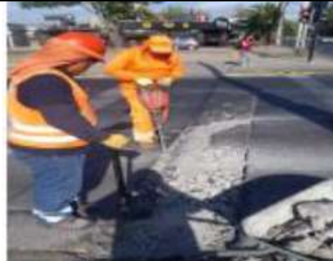
Reparación de bacheo profundo en hormigón