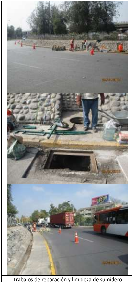
Trabajos de reparación y limpieza de sumidero

Se muestran imágenes de las actividades de conservación de la infraestructura preexistente.