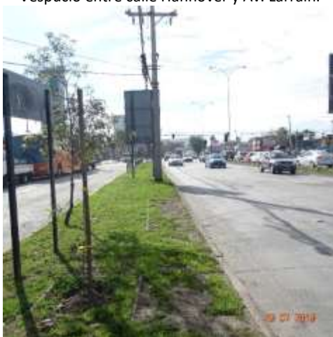
Mantenimiento de bandejón central y calzada en Av. Vespucio con Av. Eduardo Castillo Velasco.