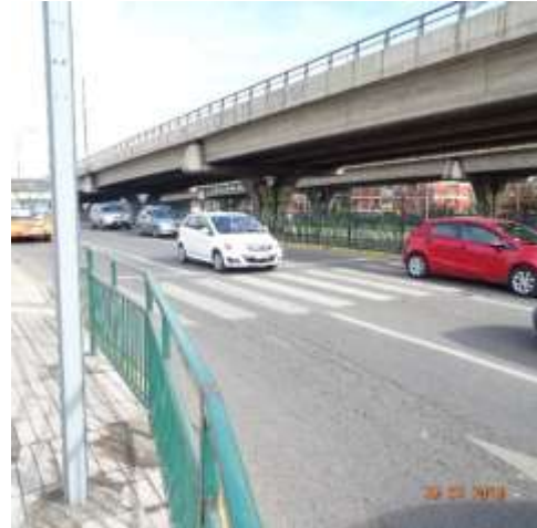
Mantenimiento de demarcación y vallas peatonales en Calle Local oriente de Av. Vespucio al sur de la Rotonda Grecia.

Se observan actividades de conservación de la infraestructura preexistente, realizada por la Sociedad Concesionaria (SC) en algunos sectores del eje principalmente enfocados a la limpieza del bandejón central.