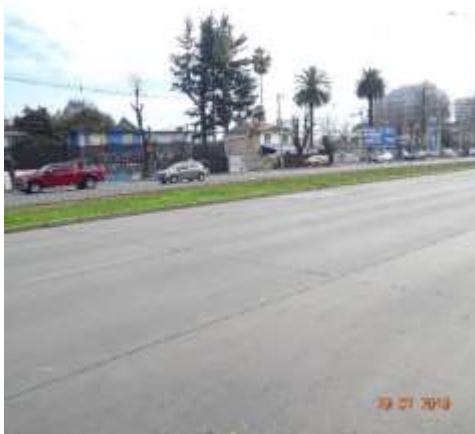
Mantenimiento de bandejón central de Av. Vespucio entre calle Hannover y Av. Larraín.