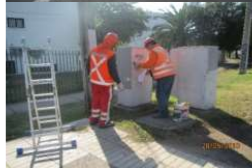
Borrado de graffitis, en Rotonda Grecia.