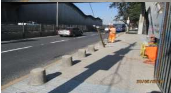
Reposición de Bolardos, frente a Metro Los Presidentes, Caletera Vespucio Poniente.