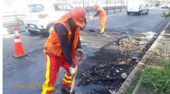
Mantención y limpieza de calzada en local poniente de Av. Vespucio al norte de Av. Los Presidentes.

Se observan actividades de conservación de la infraestructura preexistente, realizada por la Sociedad Concesionaria (SC) en algunos sectores del eje enfocados a la limpieza del bandejón central y la mantención de vallas peatonales y limpieza de calzadas, todo producto de la contingencia y emergencia durante el mes de noviembre de 2019.