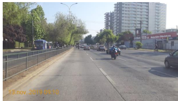
Mantención de vallas peatonales Av. Ossa al sur de Av. Larraín.