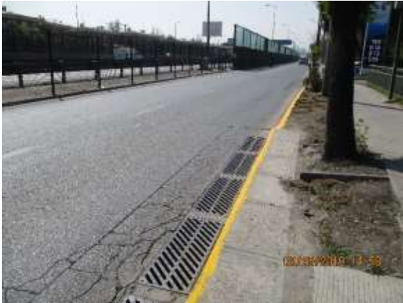
Reparación de sumideros en local poniente de Av. Vespucio con Av. El Valle.

Se observan actividades de conservación de la infraestructura preexistente, realizada por la Sociedad Concesionaria (SC) en algunos sectores del eje enfocados a la limpieza del bandejón central y la mantención de vallas peatonales y reparación de sumideros.