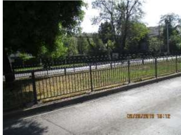
Limpieza Bandejón Central en Av. Vespucio entre Av. Simón Bolívar y Av. Echeñique.