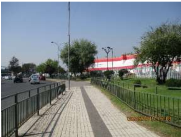
Mantención de vallas peatonales Rotonda Grecia.