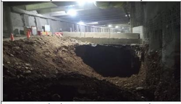
Excavación bajo Losa Intermedia Dm 4900 hacia el sur acceso N-2.