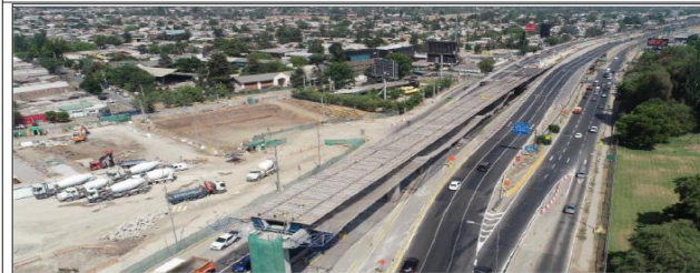
Viaducto El Salto desde Estribo 1 a Cepa 9 con prelosas tablero ir