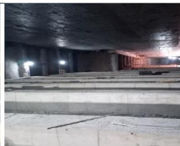
Trinchera Intermedia N°1 5.320: primer nivel estam