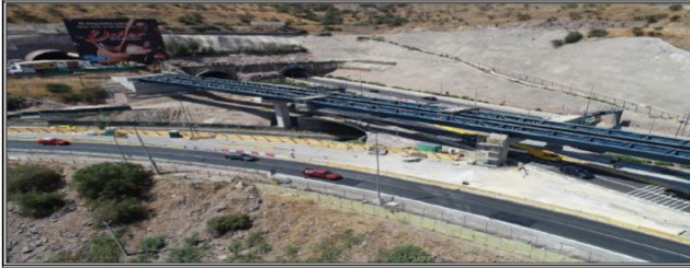
Viaducto El Salto: panorámica Portal Norte del túnel con vigas in: