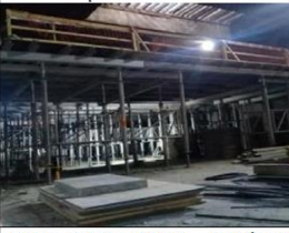
Pozo 2 Dm 7200.- Entibaci de recintos técnicos.