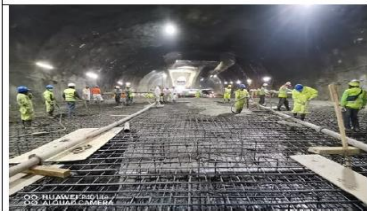
Túnel Híbrido Losa Intermedia 69.- Nivel -1. (Dm 7.490 - 7.520).