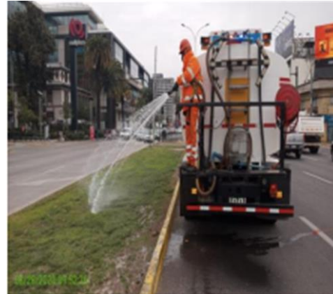
Riego de paisajismo.

Se observan actividades de conservación de la infraestructura preexistente, realizada por la Sociedad Concesionaria (SC) en algunos sectores del eje enfocados a la limpieza del bandejón central, riego y mantención de paisajismo, limpieza de calzadas y sumideros, durante el mes de septiembre de 2020.