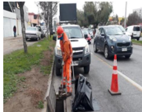
Limpieza de sumideros.