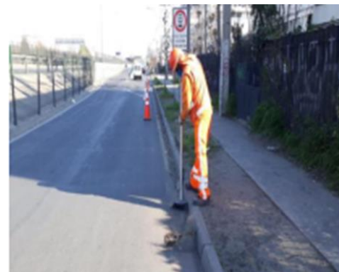
Limpieza calzadas y soleras.