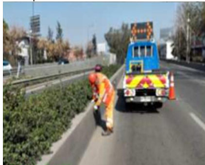
Extracción de Vegetación.