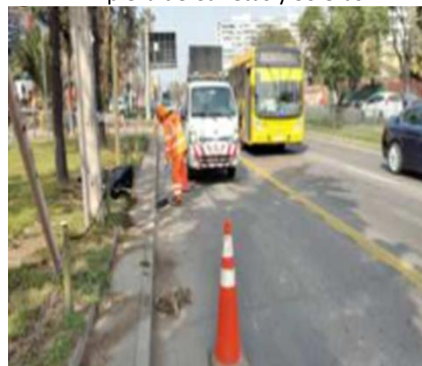
Limpieza elementos retro reflectantes.