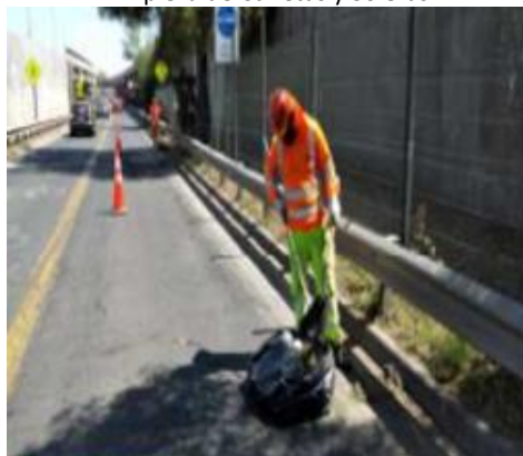
Extracción de vegetación.