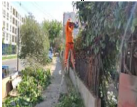
Borrado de grafitis.