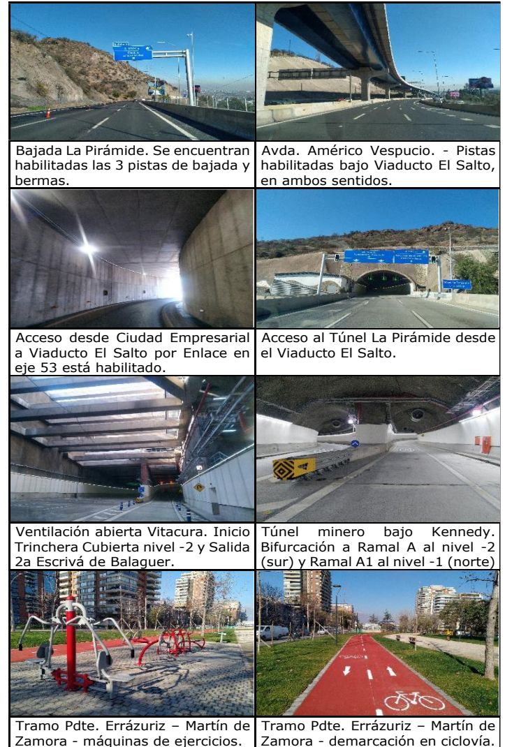
Bajada La Pirámide. Se encuentran habilitadas las 3 pistas de bajada y bermas. Avda. Américo Vespucio. - Pistas habilitadas bajo Viaducto El Salto, en ambos sentidos.